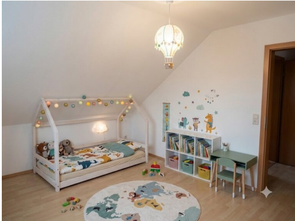
Kinderzimmer - Virtuell eingerichtet