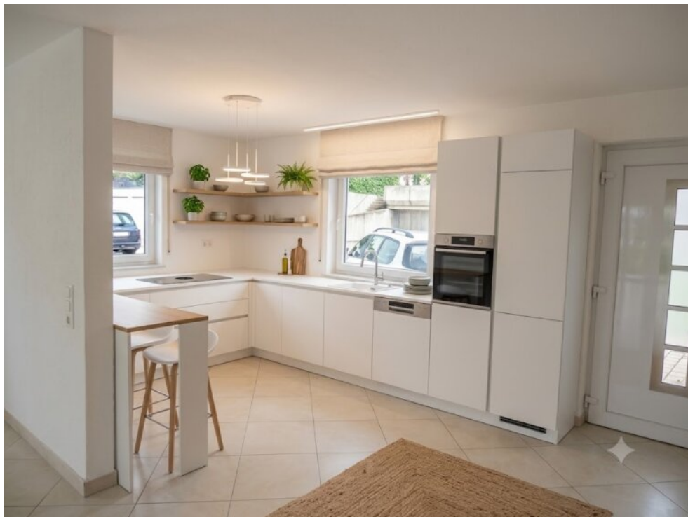
Küche - Virtuell eingerichtet