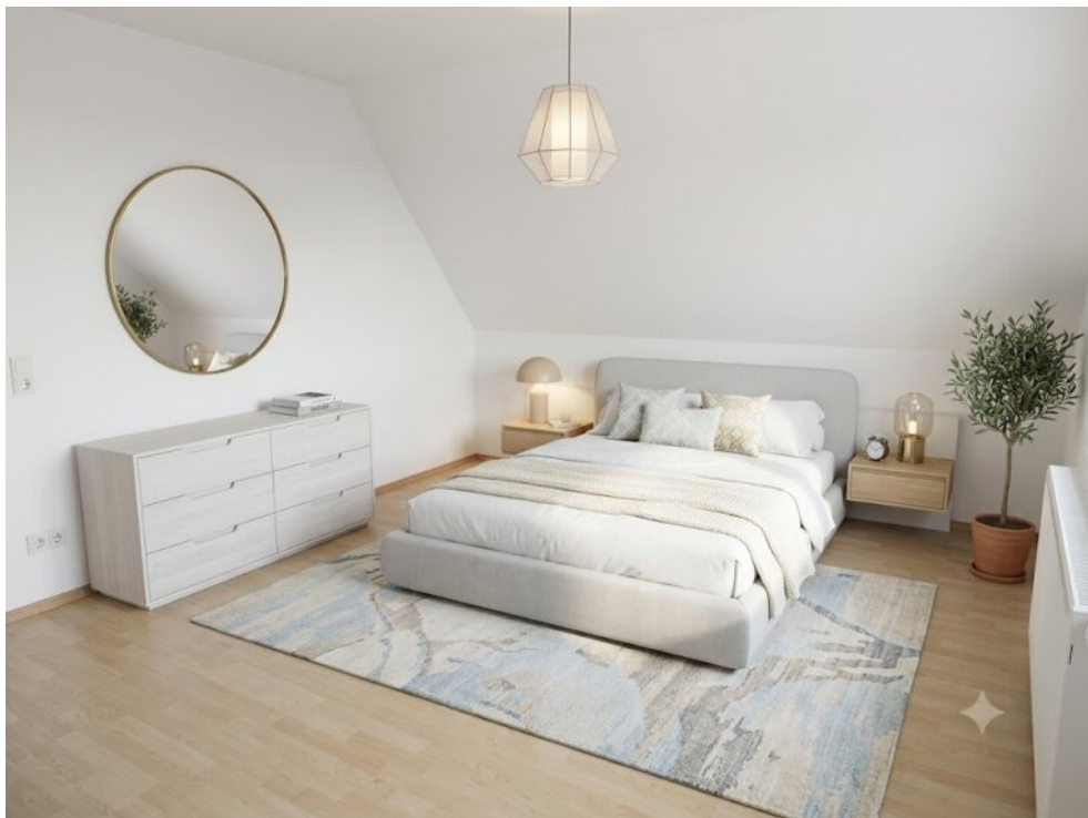
Schlafzimmer - Virtuell eingerichtet