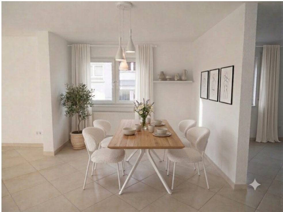
Essbereich - Virtuell eingerichtet