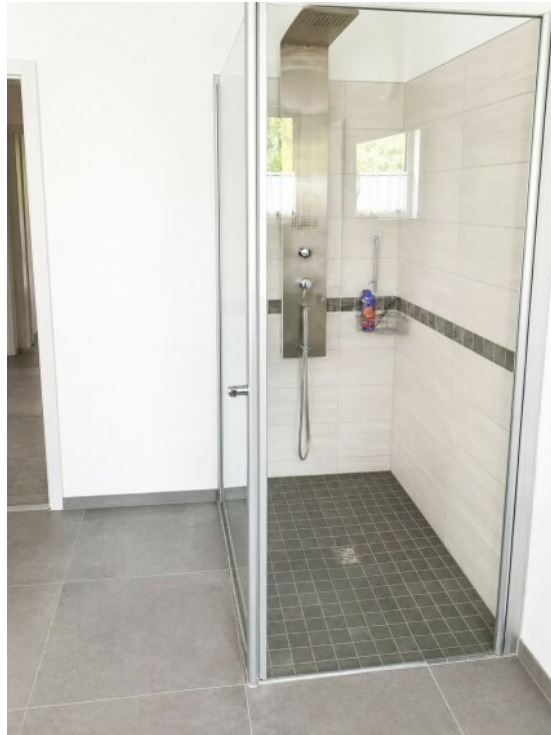
Dusche im Badezimmer