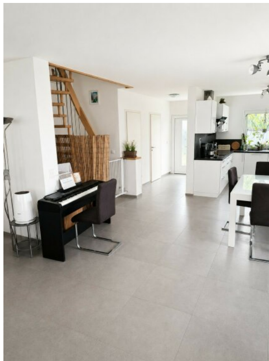
Eingangsbereich mit Küche