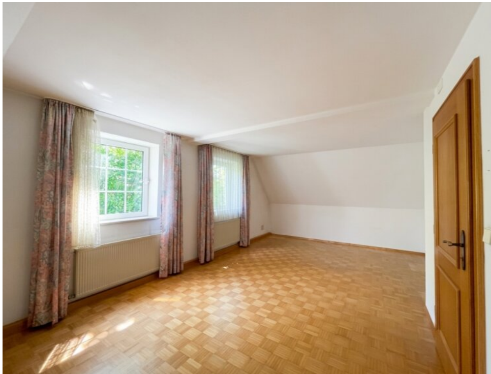
Großer Schlafraum im OG