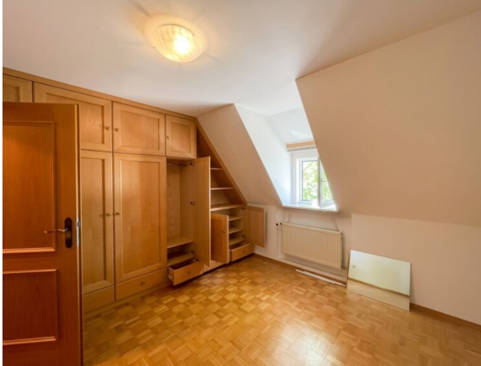
Kinder : Arbeitszimmer