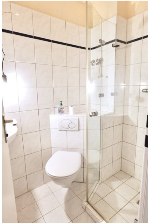
Gäste-WC mit Dusche