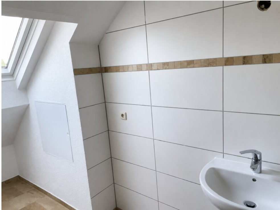
Bad mit Fenster im OG