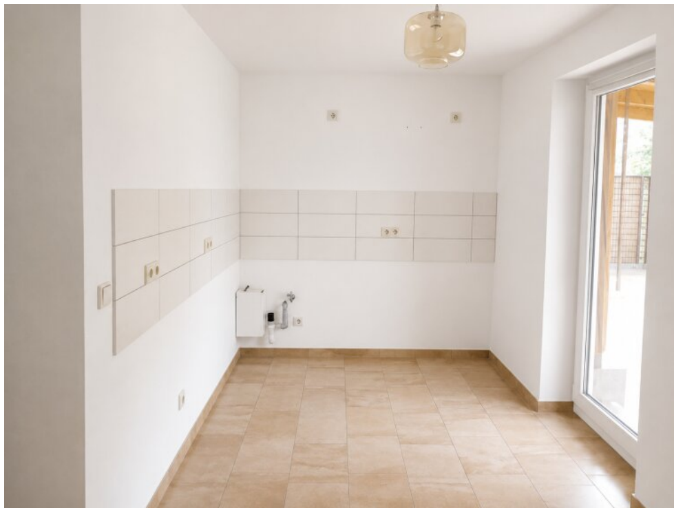
Küche mit Terrassenzugang