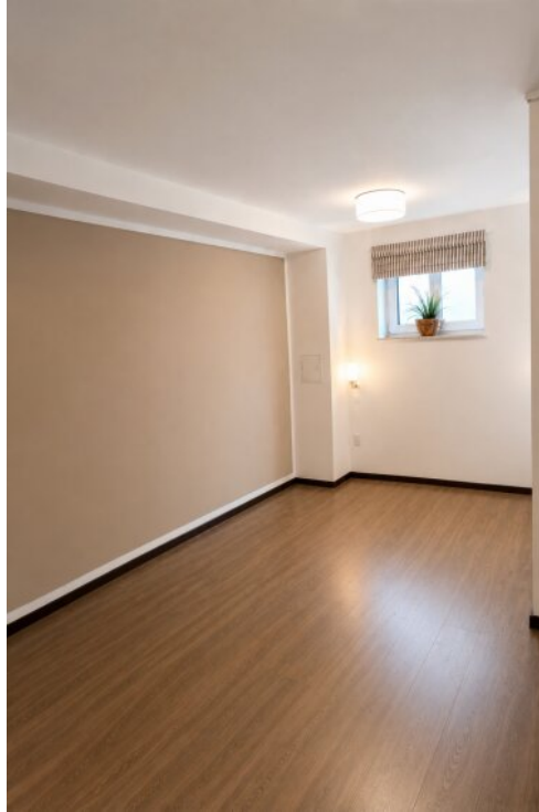
Schlafzimmer / Hobbyraum UG