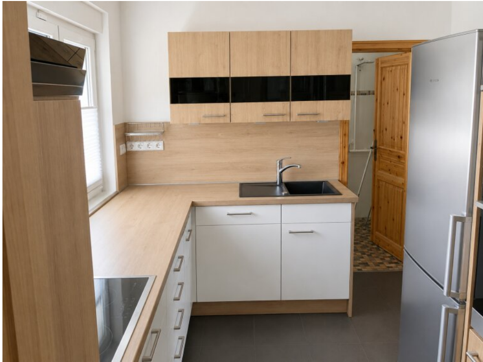
Einbauküche Eingang Flur