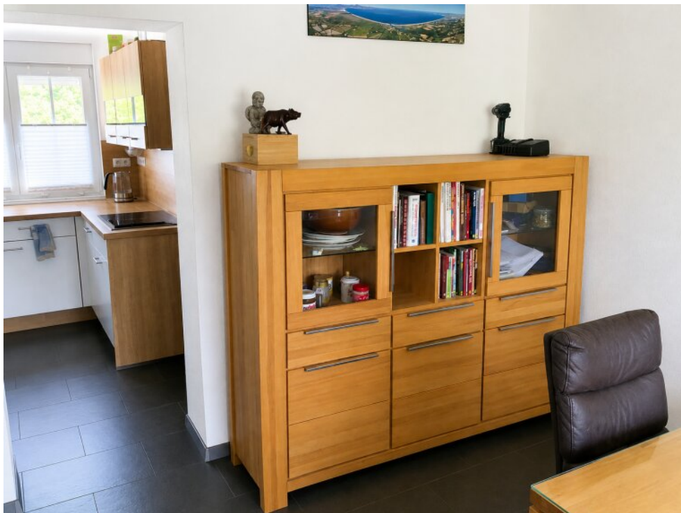
Essbereich Zugang Küche EG