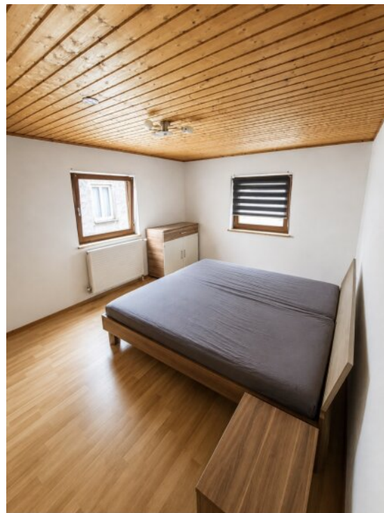
Schlafzimmer 3 OG