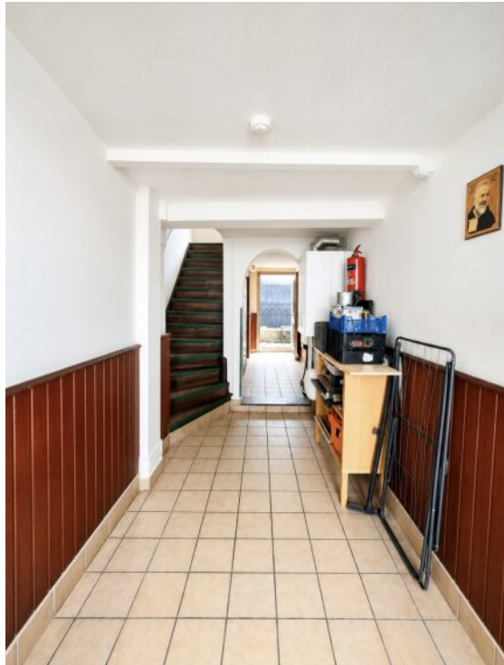
Eingang/ Diele EG