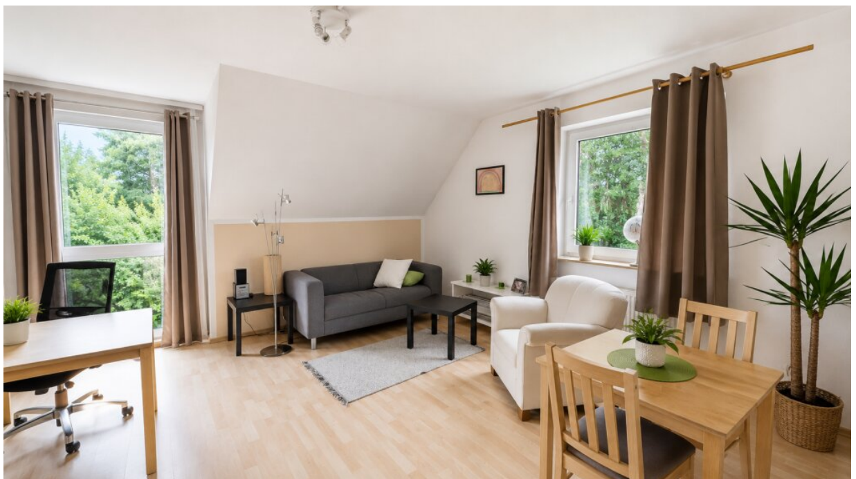
OG Zimmer links mit 2 Fenstern