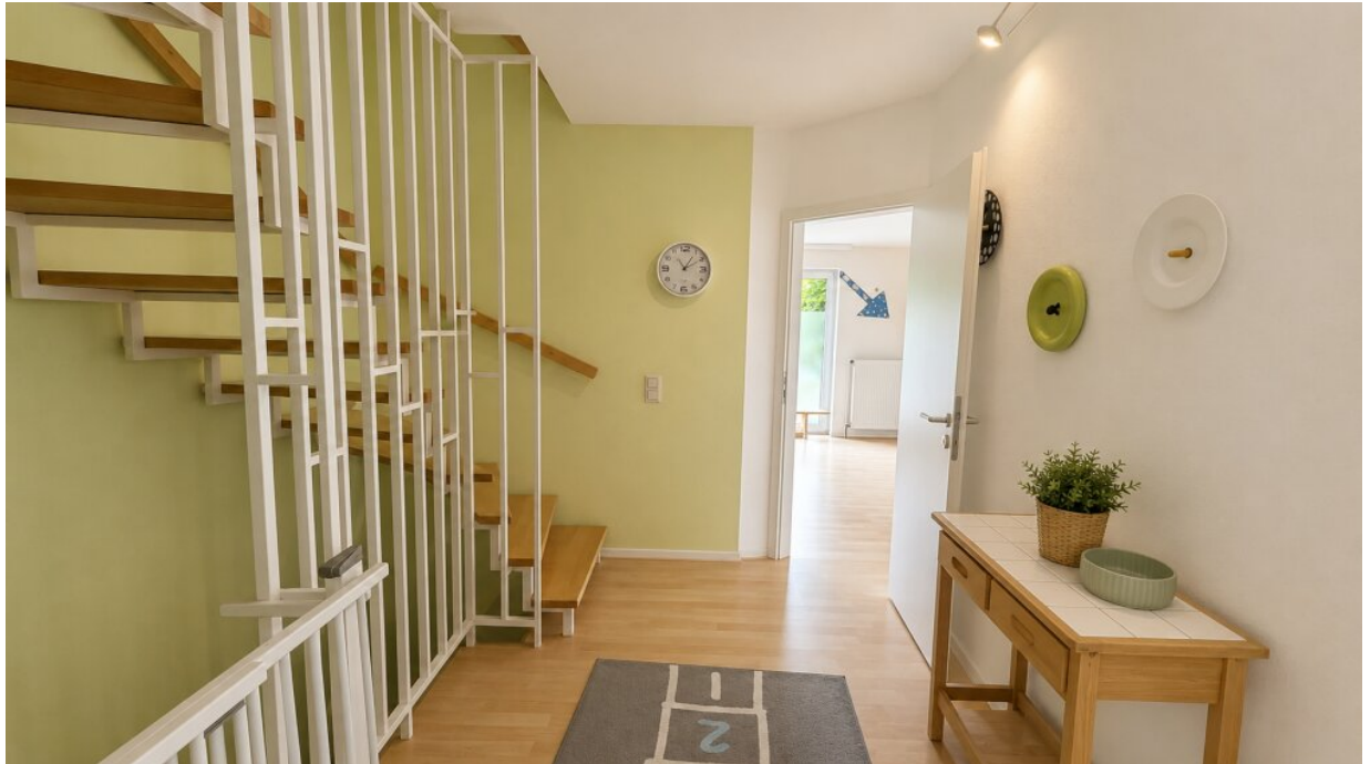
EG offene Treppe