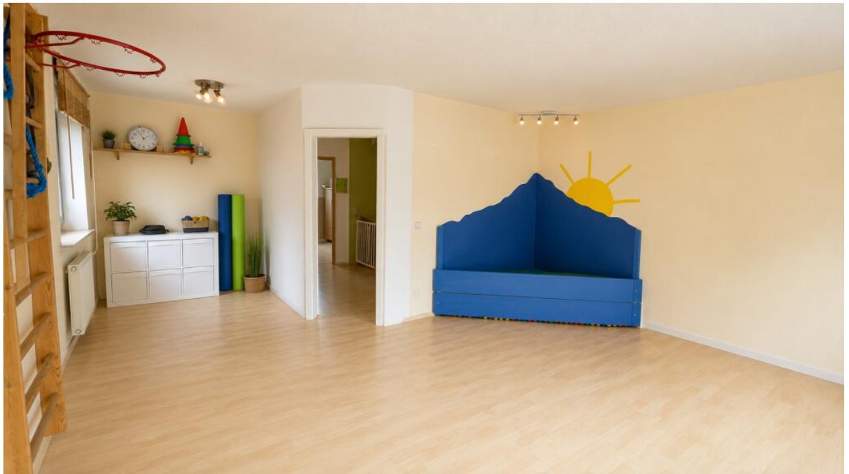
EG Lebensraum, der erweitert werden kann