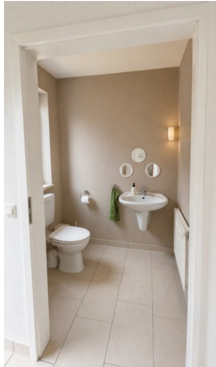
EG Gäste - WC