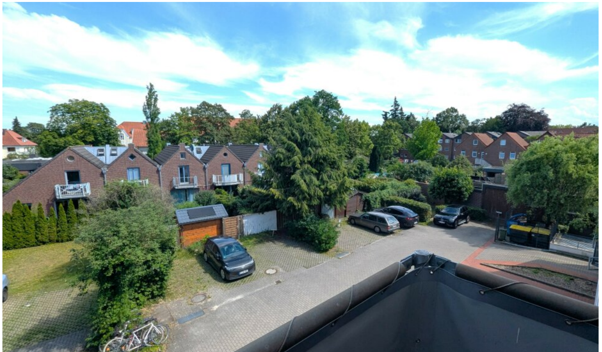
Blick vom Balkon in ruhige Hinterhoflage