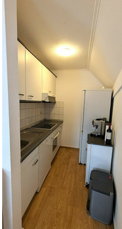
Enbauküche mit hochwertiger Ausstattung