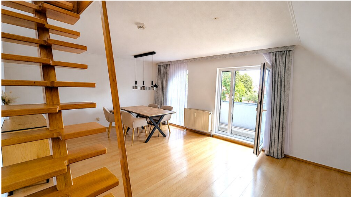
Großer Lebensraum mit Zugang zum Balkon