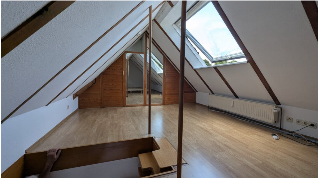
Ausgebautes DG mit Einbauschränk