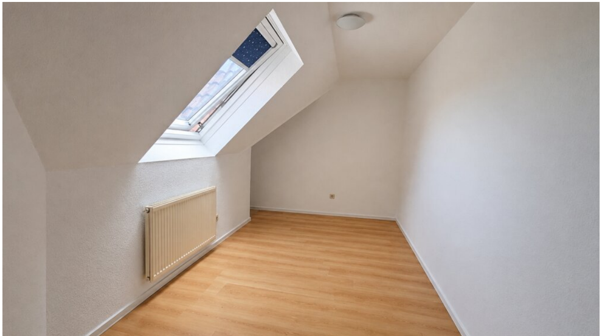
Büro, Kinder- oder Gästezimmer mit Abseite