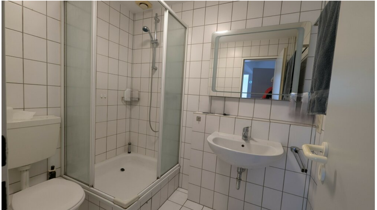
Badezimmer mit stabiler Duschtrennwand