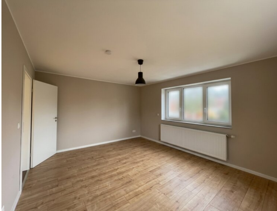
Kinderzimmer : Arbeitszimmer