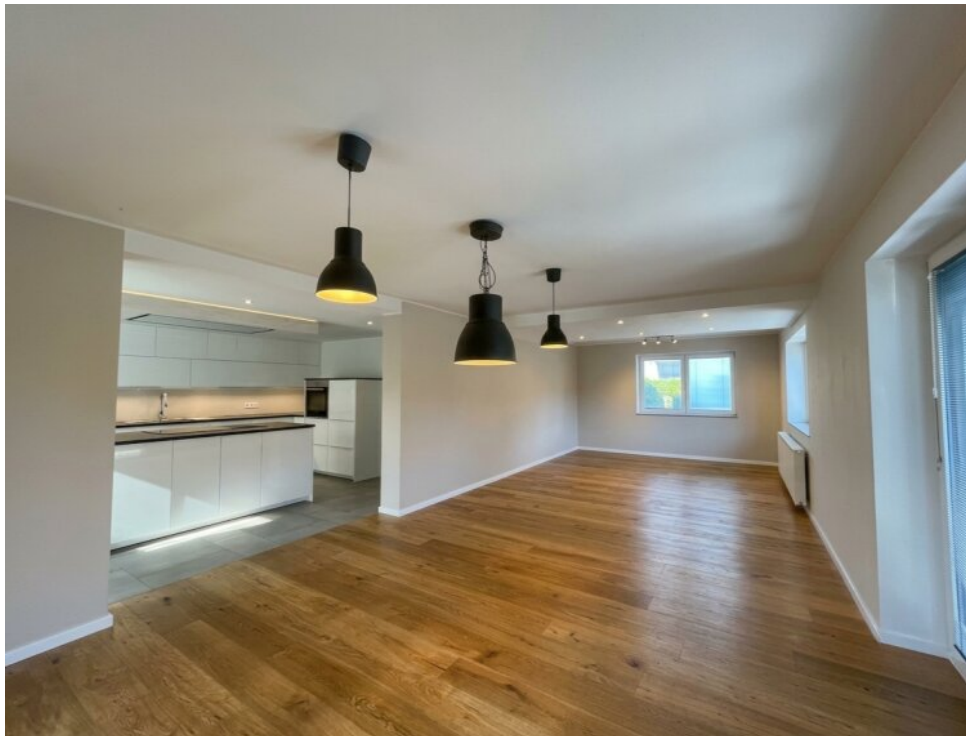
Offene Küche : Woh-:Essbereich