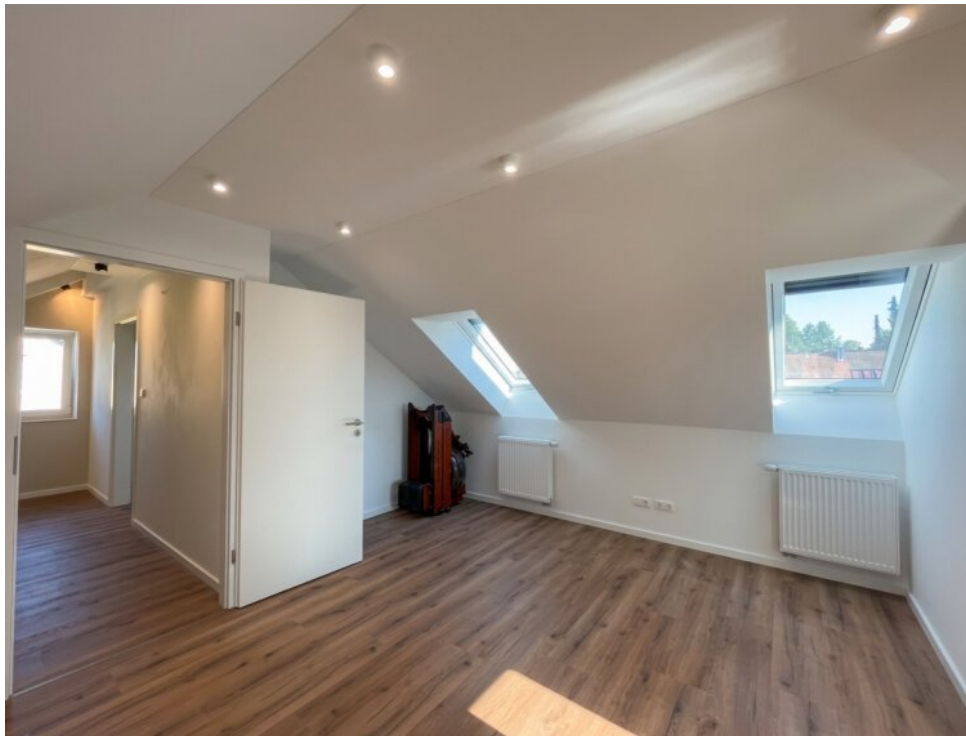
Schlafzimmer mit eigener Dusche