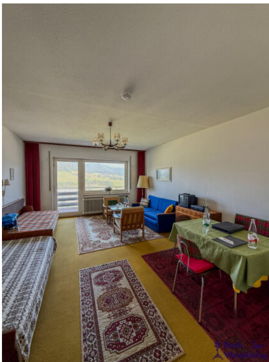
Wohn / Schlafzimmer