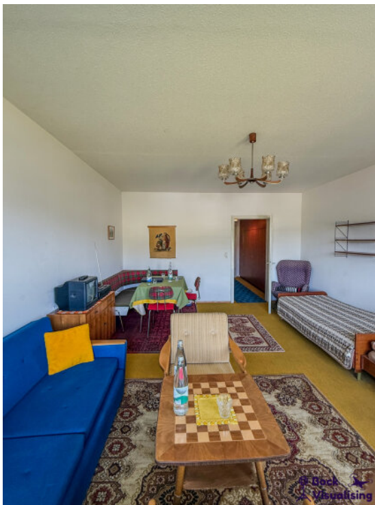
Wohn / Schlafzimmer