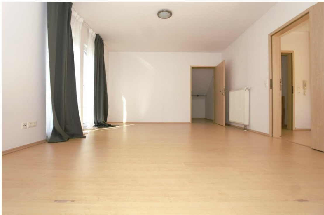
DG Gästezimmer mit Ankleide