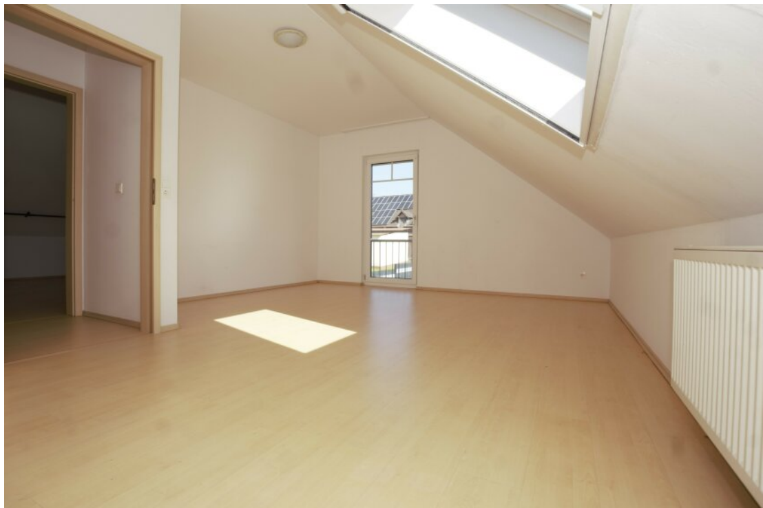
DG Kinderzimmer zwei