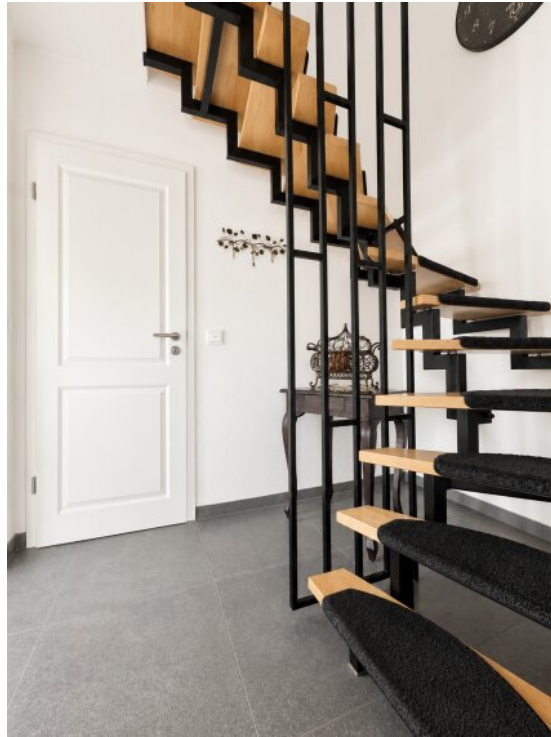
Treppe zum OG