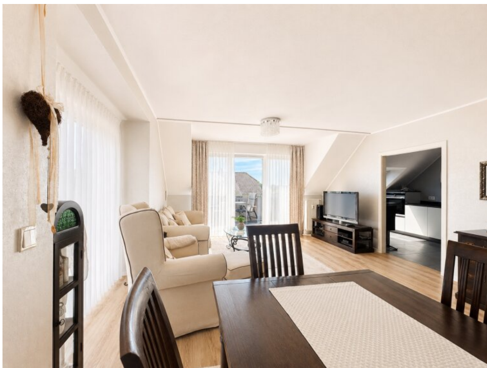
Blick zum Balkon und Küche