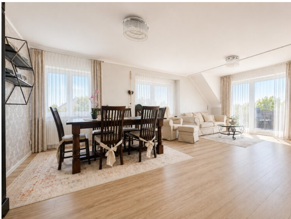
Wohn-/ Esszimmer mit Balkon