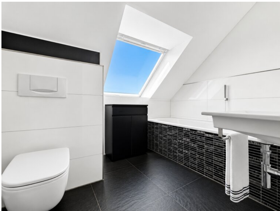
OG Wannenbad mit Fenster