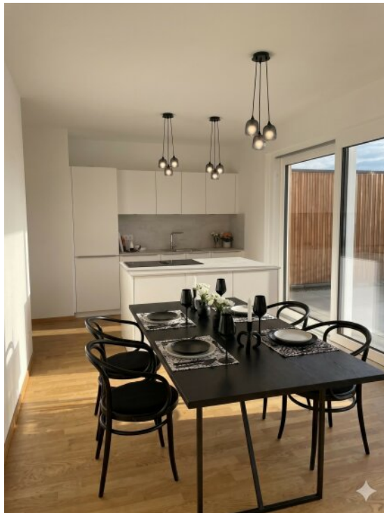
Esszimmer - Virtuell eingerichtet