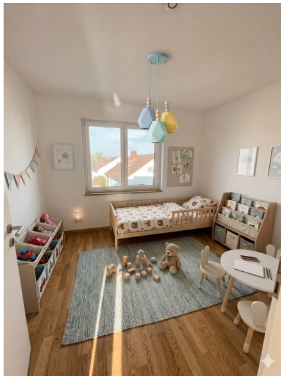
Kinderzimmer- Virtuell eingerichtet