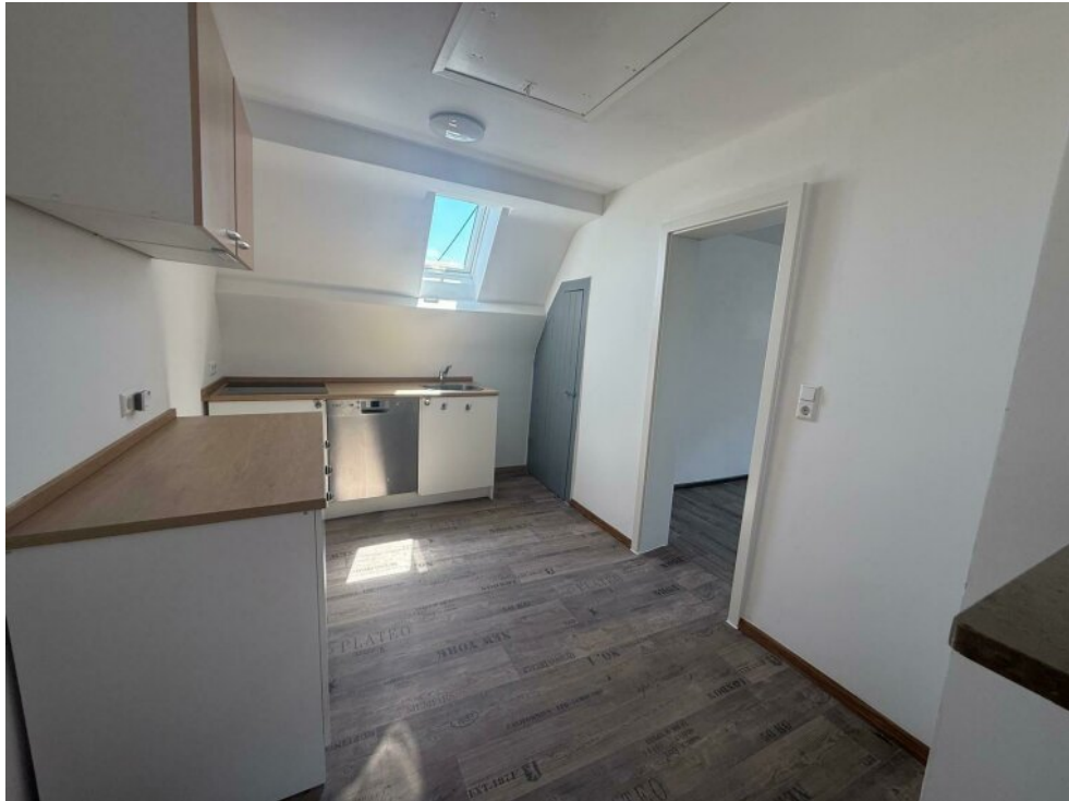
Küche mit Abstellkammer