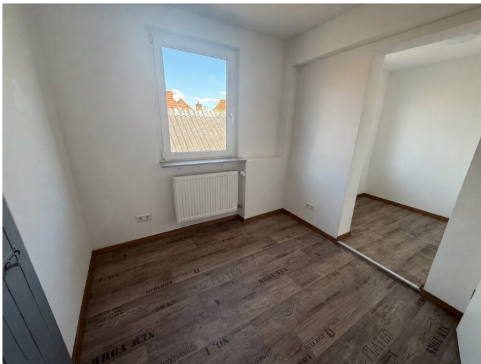
Schlafzimmer III 2-geteilt