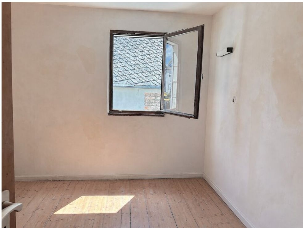
Zimmer II im OG