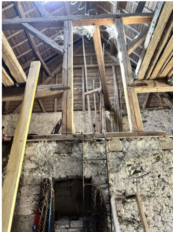
Dachboden in der Scheune