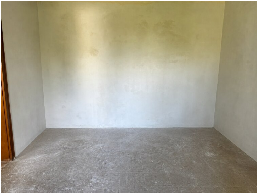
Zimmer III im OG