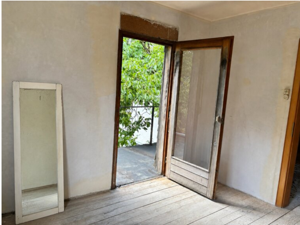
Schlafzimmer mit Zugang Balkon OG