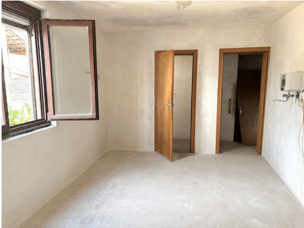
Küche mit Speisekammer EG