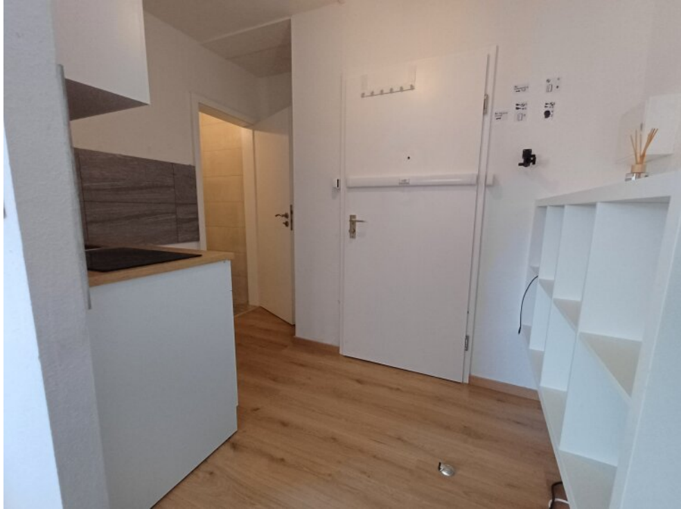
Eingangsbereich + Kochecke