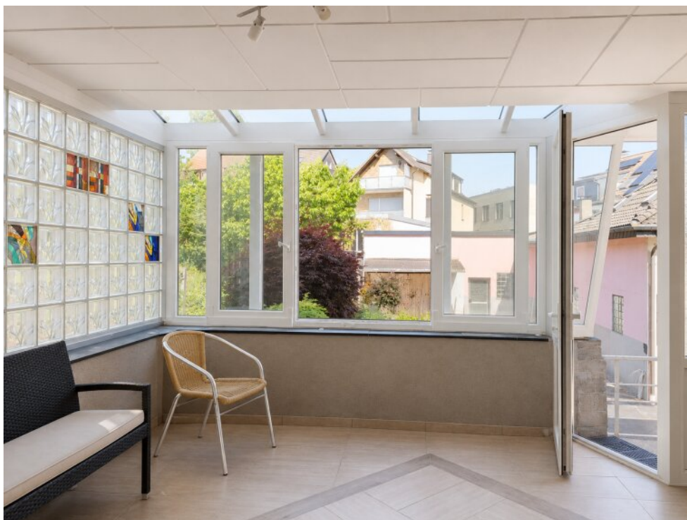
KI Wintergarten EG