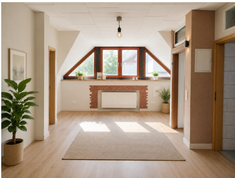
KI-staging Wohnung in Gewerbe