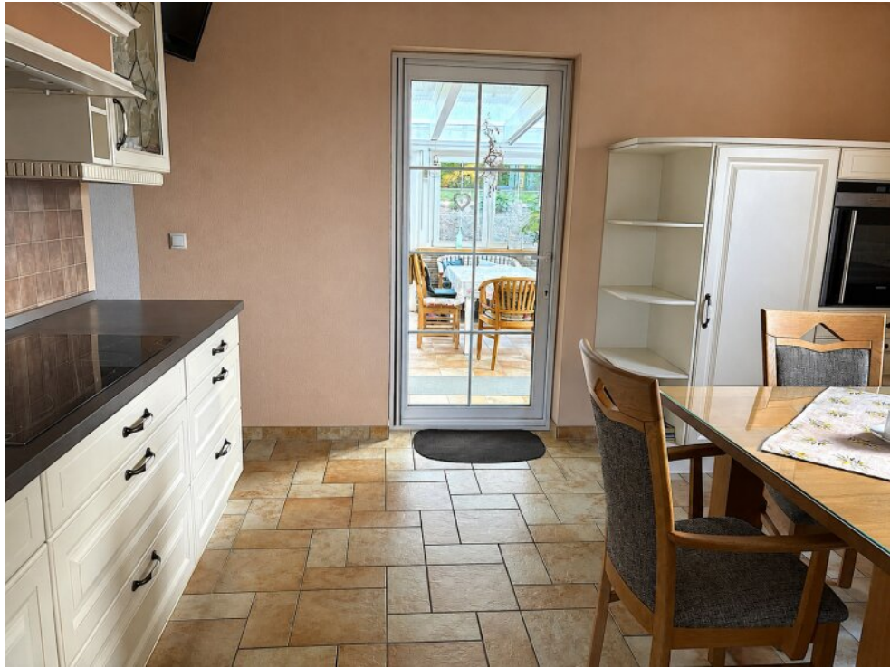
Küche mit Ausgang Wintergarten