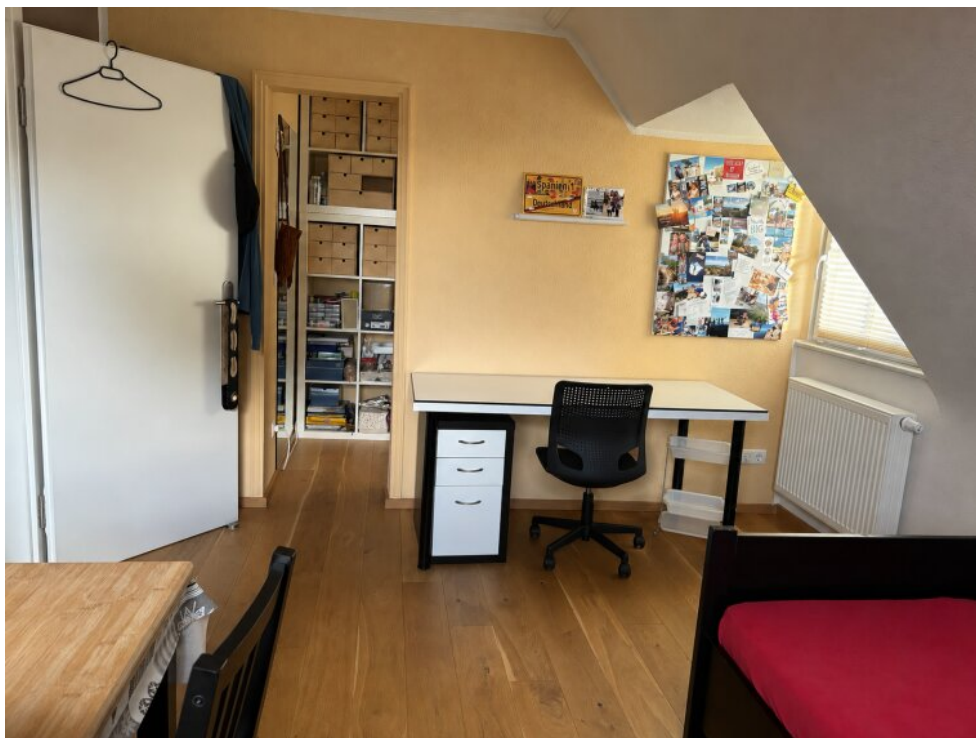
Kinderzimmer mit Ankleide OG