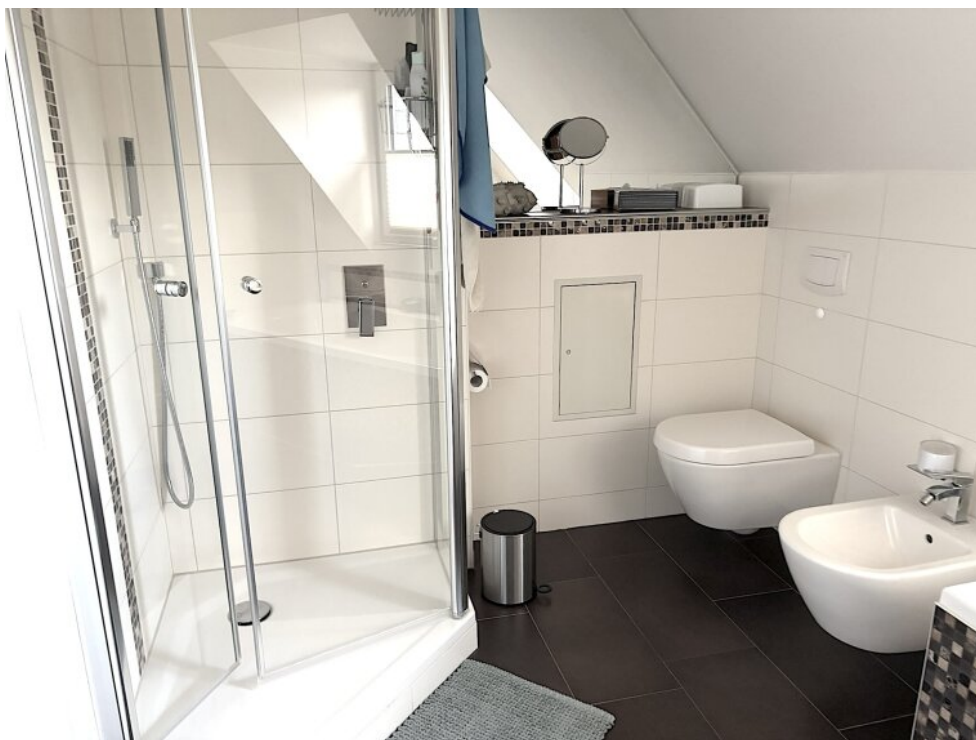
Tageslichtbad mit Dusche OG