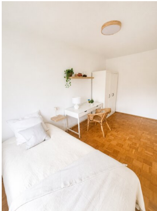
Gästezimmer / WG Zimmer