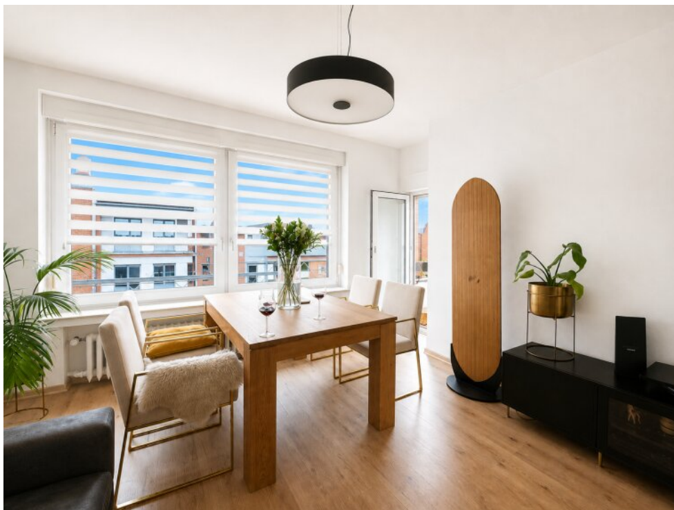
Wohnbereich mit Balkon