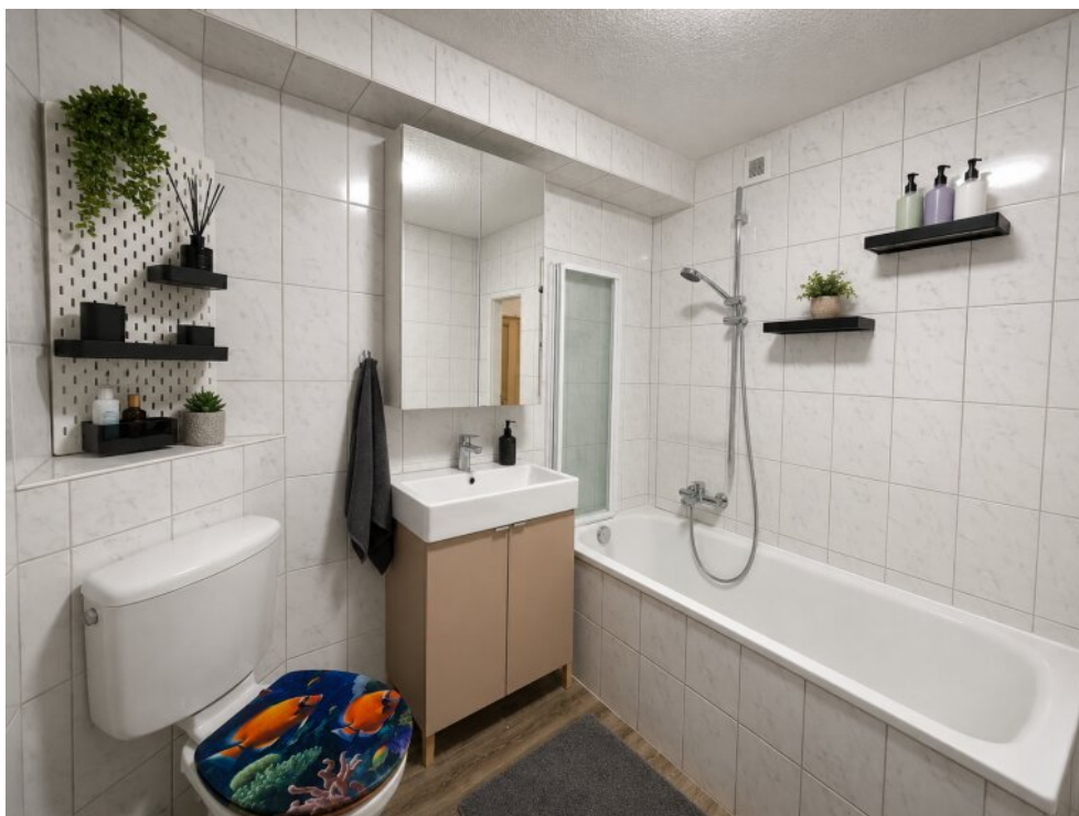
Bad WE 3