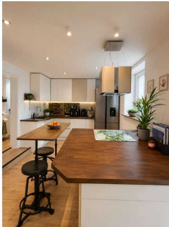
Küche WE 4