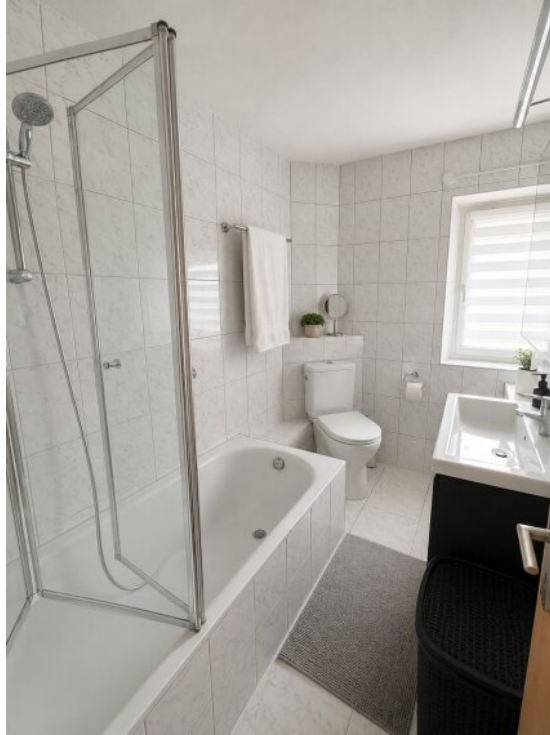
Bad 2 WE 4