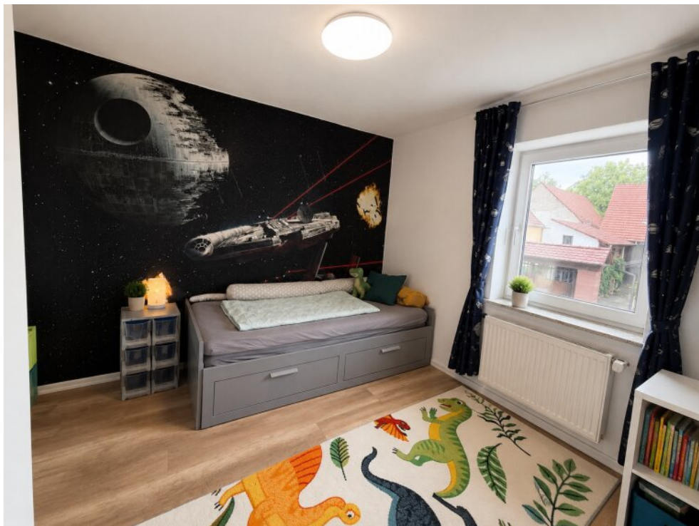
Schlafzimmer Ki 2