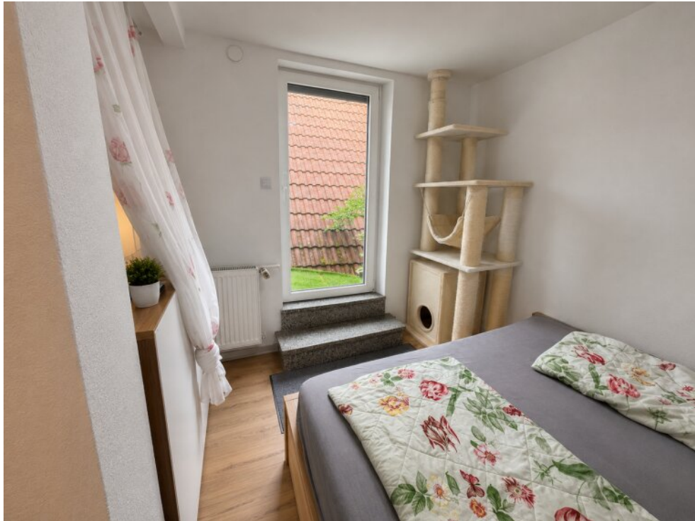
Schlafzimmer mit Katzenterrasse