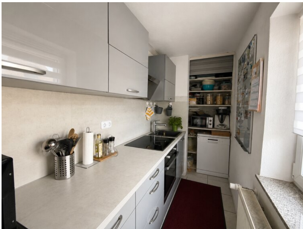
Küche WE 3