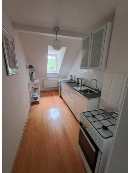
Küche im DG