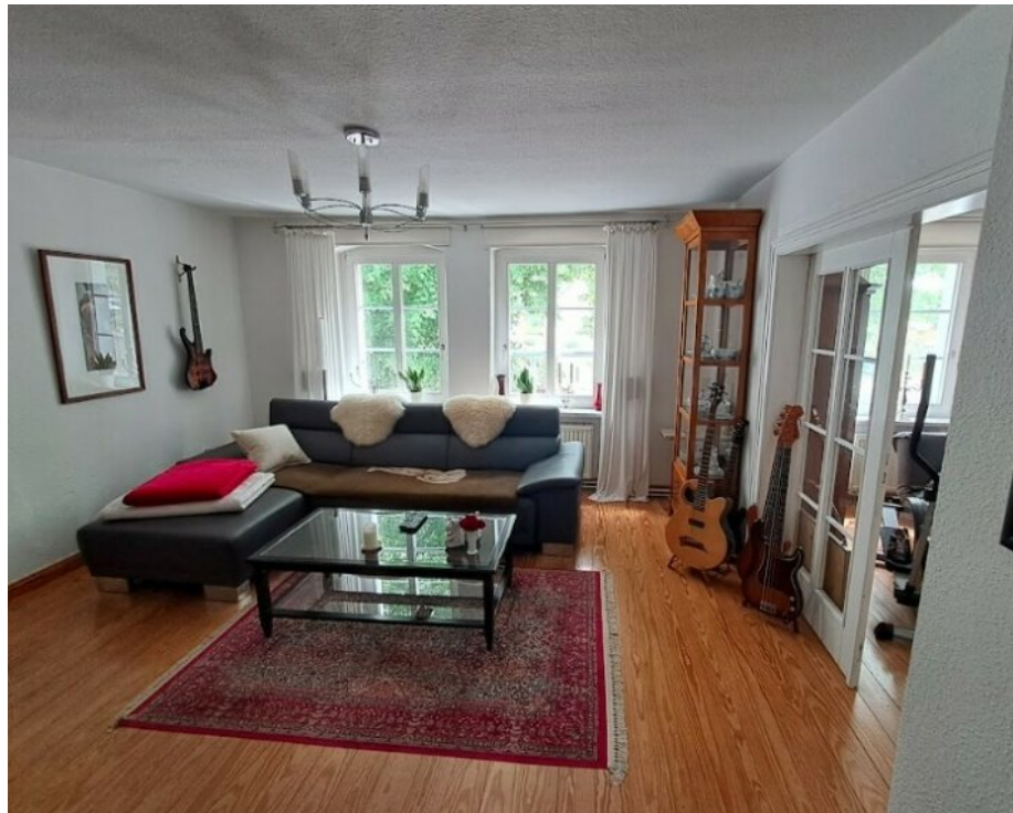
Musikzimmer im OG