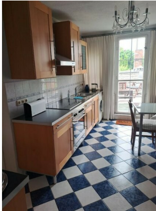
Küche im OG