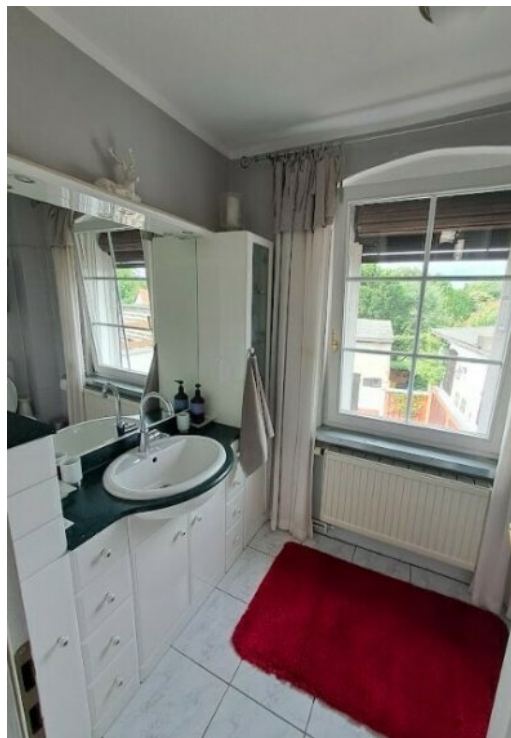
Bad mit Dusche im OG