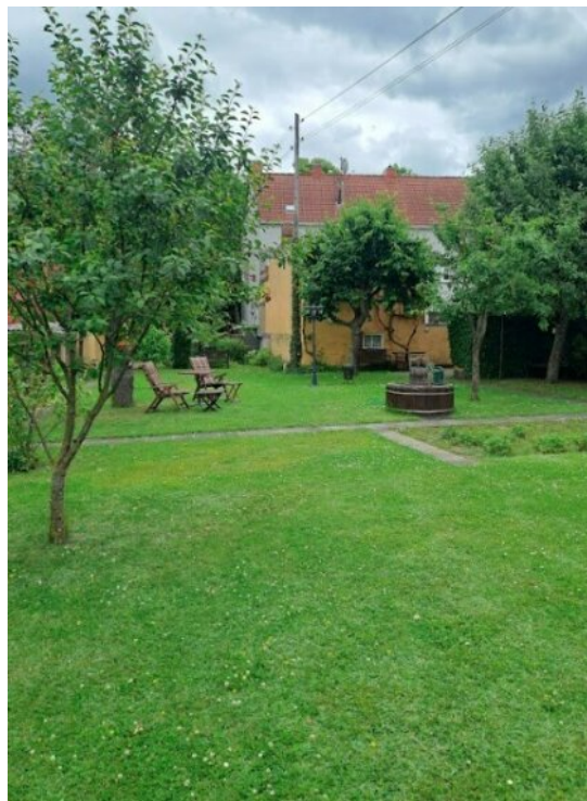
Großer Garten mit Gartenhaus