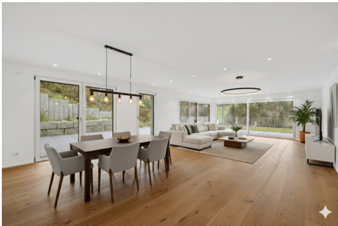
Wohnbereich / Beispiel