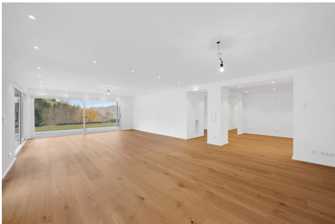
Wohn-Essbereich 50 qm