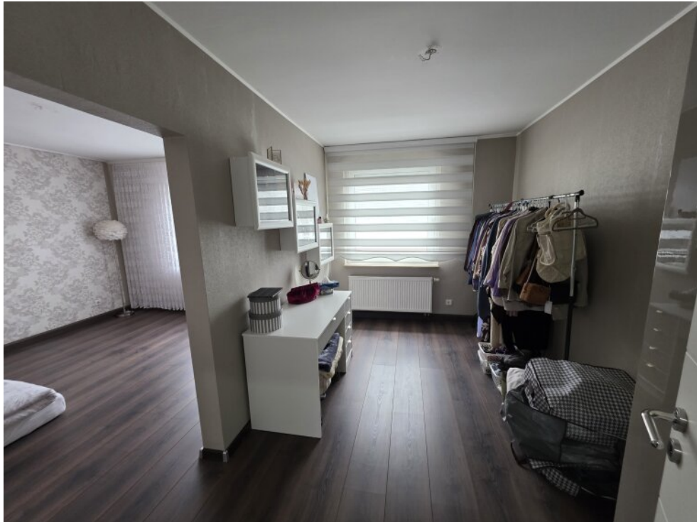
Wohnbereich & Schlafzimmer