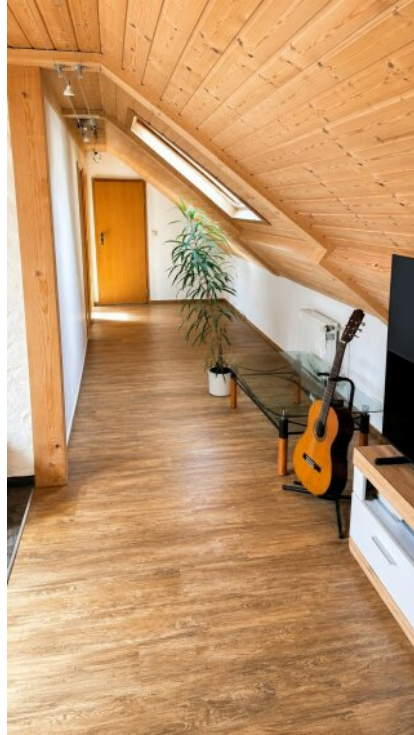
Flur 3 Zimmerwohnung