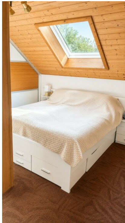
Schlafzimmer 3 Zimmerwohnung