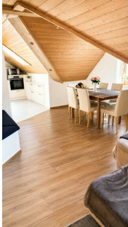
Essbereich 3 Zimmerwohnung