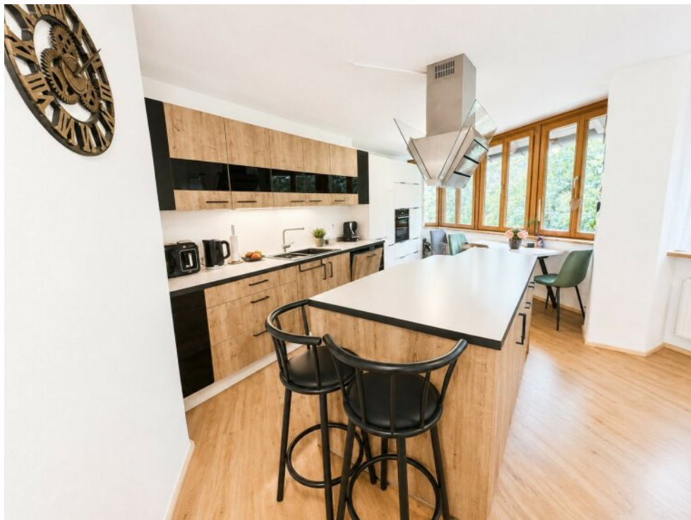
Küche 4 Zimmerwohnung