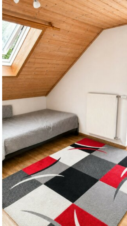
Schlafzimmer 3 Zimmerwohnung