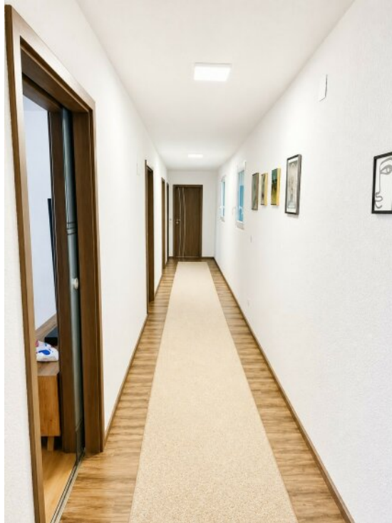
Flur 4 Zimmerwohnung