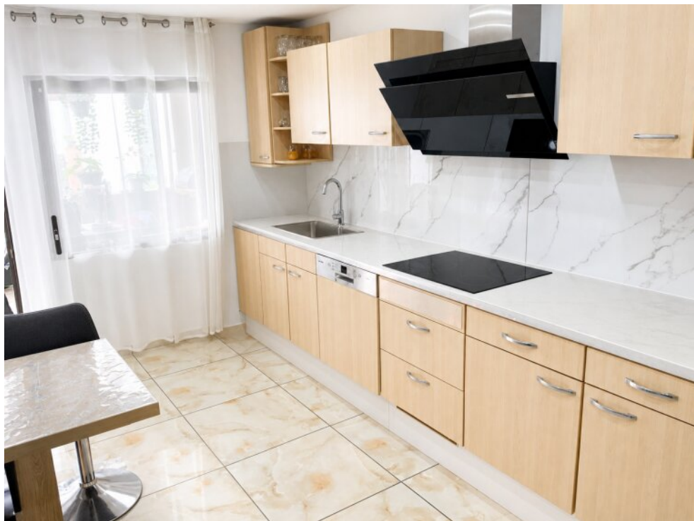
Neuwertige Einbauküche EG