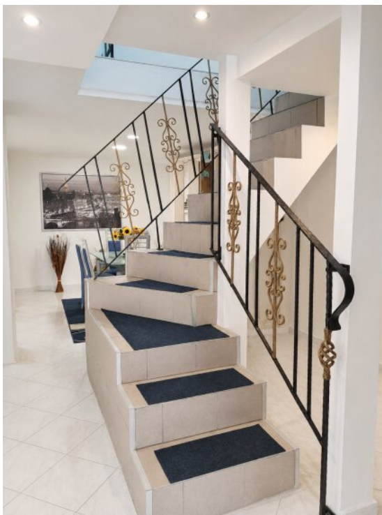
Zugang zum OG