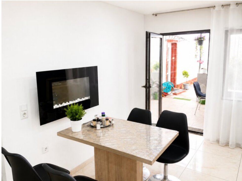
Esszimmer EG Ausgang Terrasse