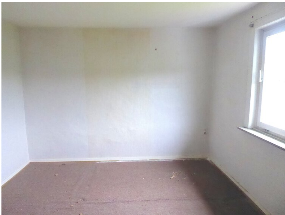
Linkes Zimmer OG