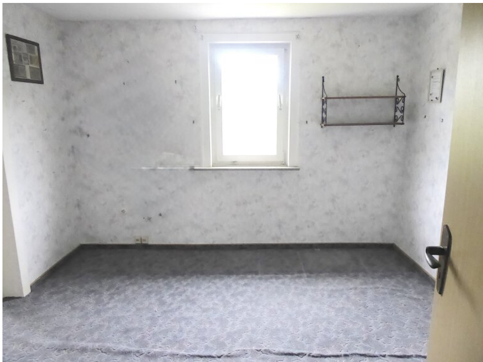
Rechtes Zimmer OG