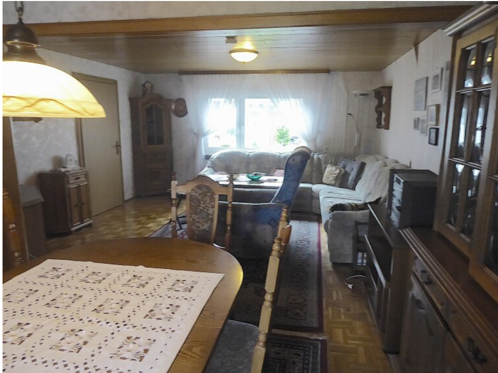
Wohn-Ess Bereich EG