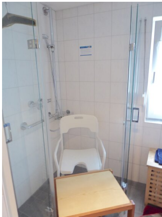
Tageslichtbad EG mit Dusche