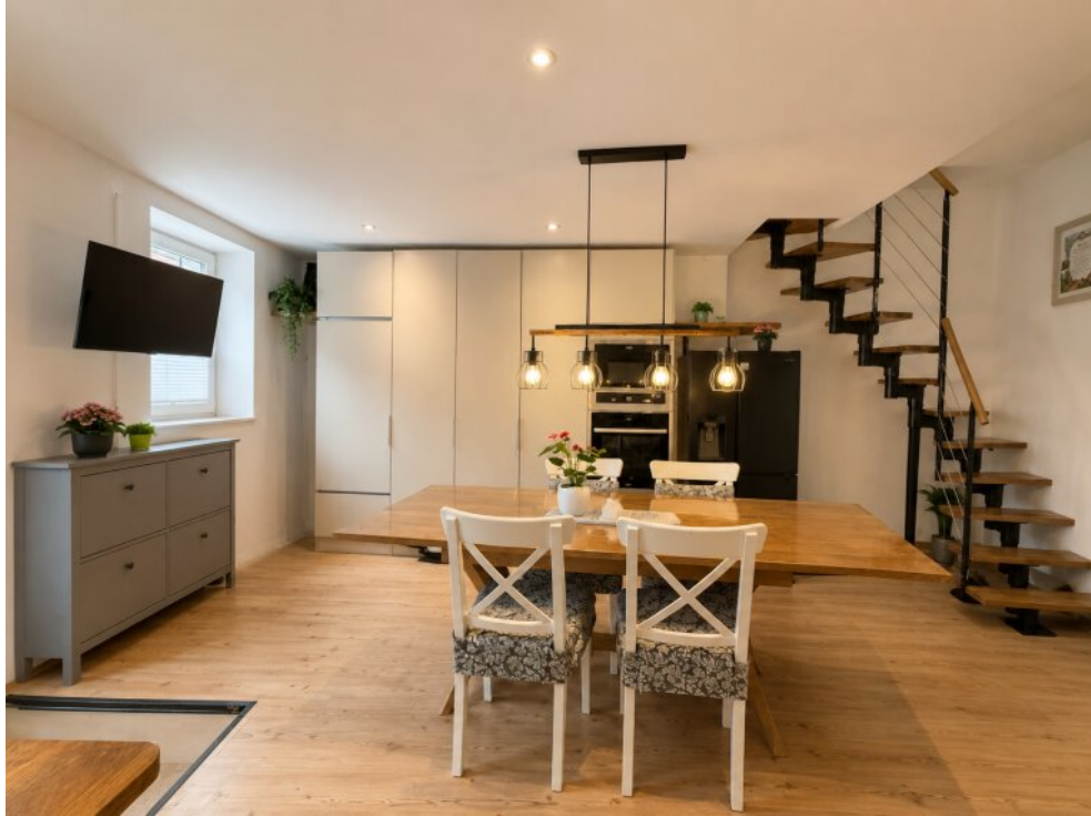
Esszimmer WE 4