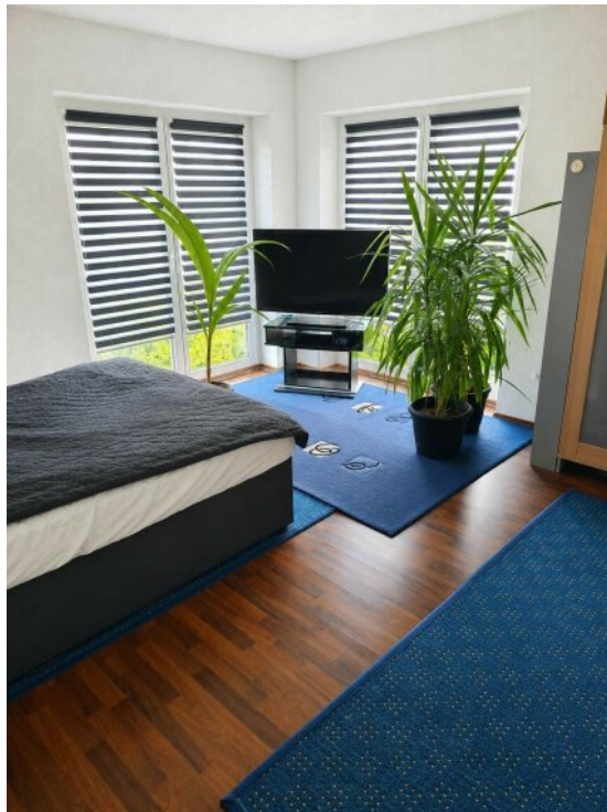
2- Zimmer OG andere Ansicht