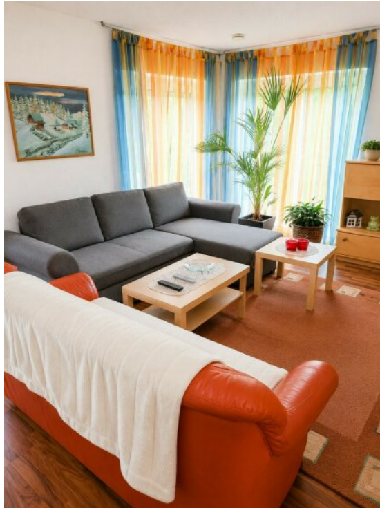
Wohnzimmer 2 Ansicht