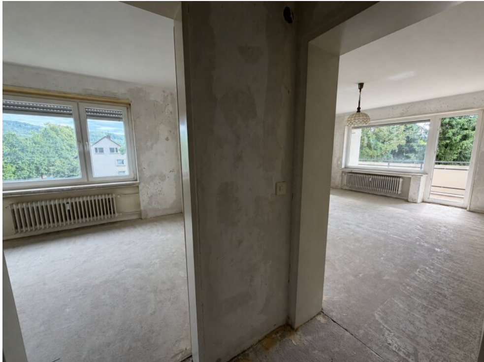
Schlafzimmer und Wohnzimmer