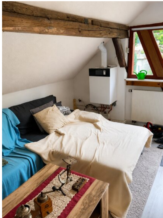
Neue Gastherme 2025