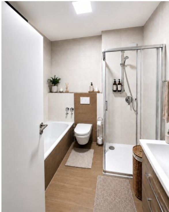
Bad Wanne und Dusche