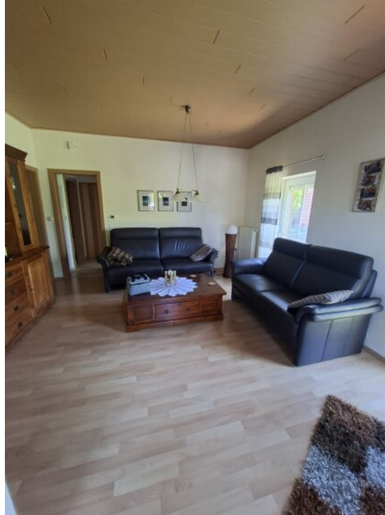
Wohnzimmer Whg 2