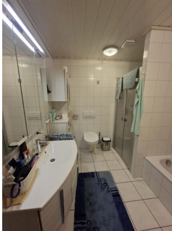
Badezimmer 1 Hauptwohnung