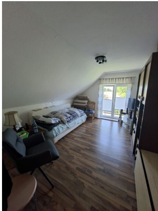
Zimmer Whg 1