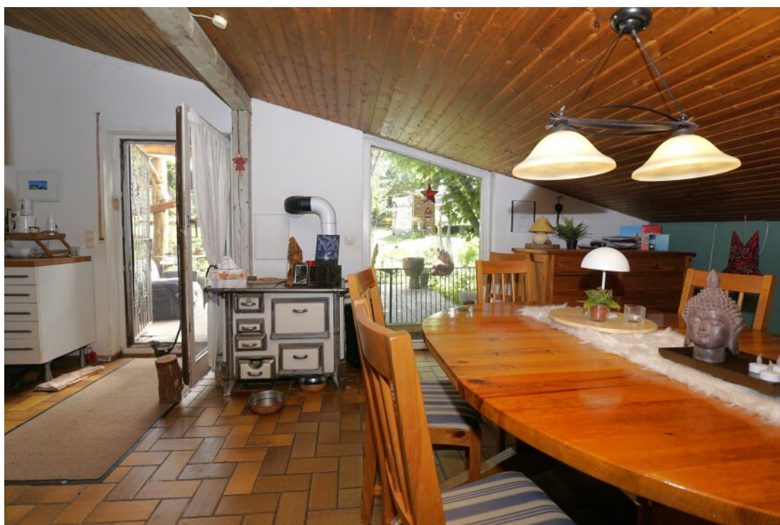
Essbereich mit Terrasse und Garten