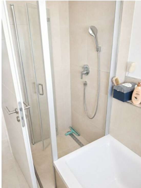
Dusche im Bad