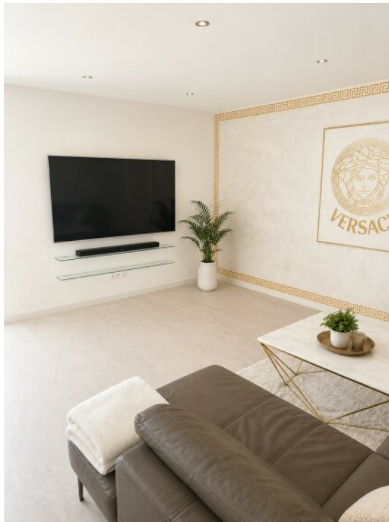
Wohnzimmer mit Fernseher