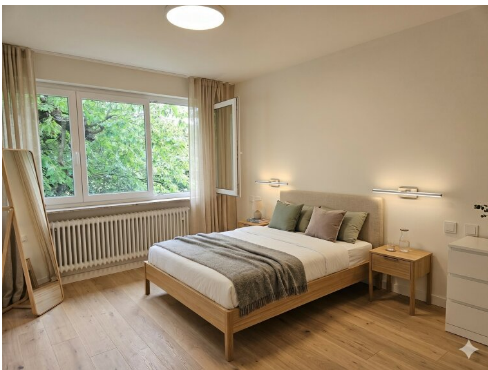
Schlafzimmer-mit KI bearbeitet