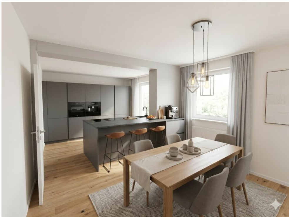
Küche-Esszimmer-mit KI bearbeitet