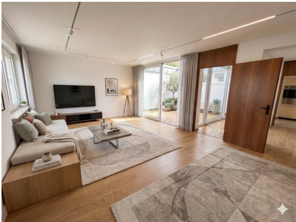
Wohnzimmer-mit KI bearbeitet