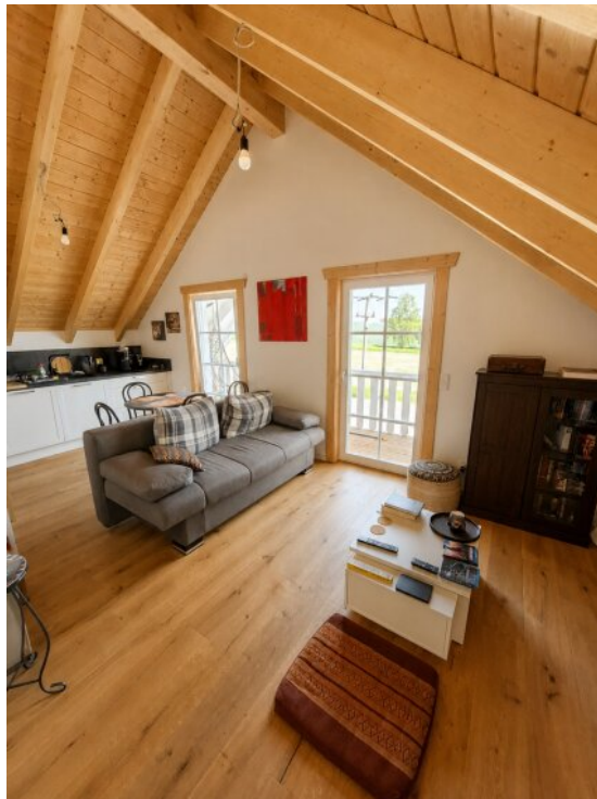
Wohn / Essbereich DG