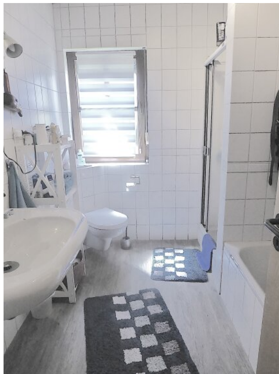
Tageslichtbad mit Wanne und Dusche OG