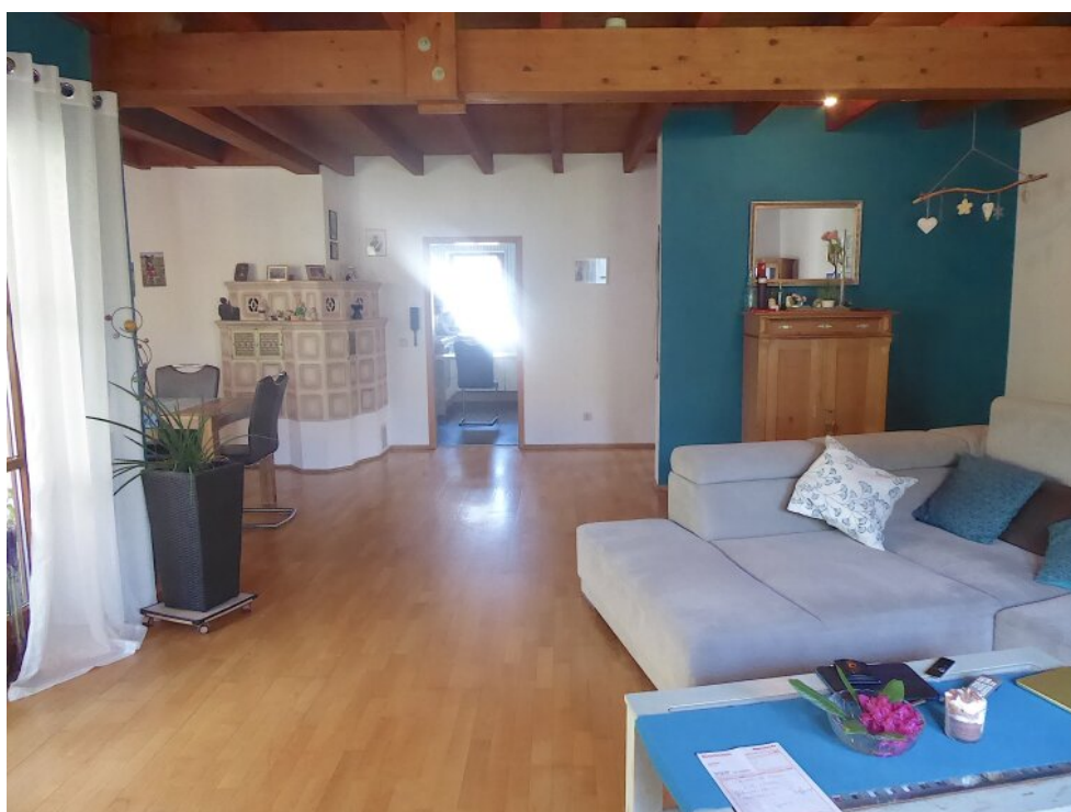
Offener Wohn-Eßbereich OG