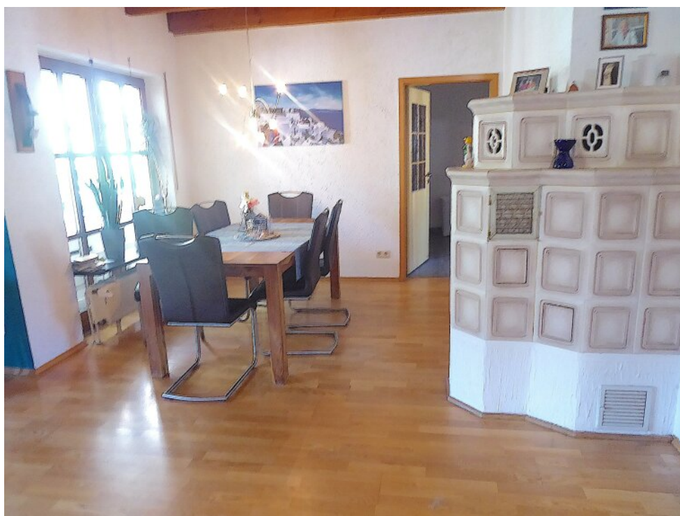
Essbereich mit Kachelofen OG