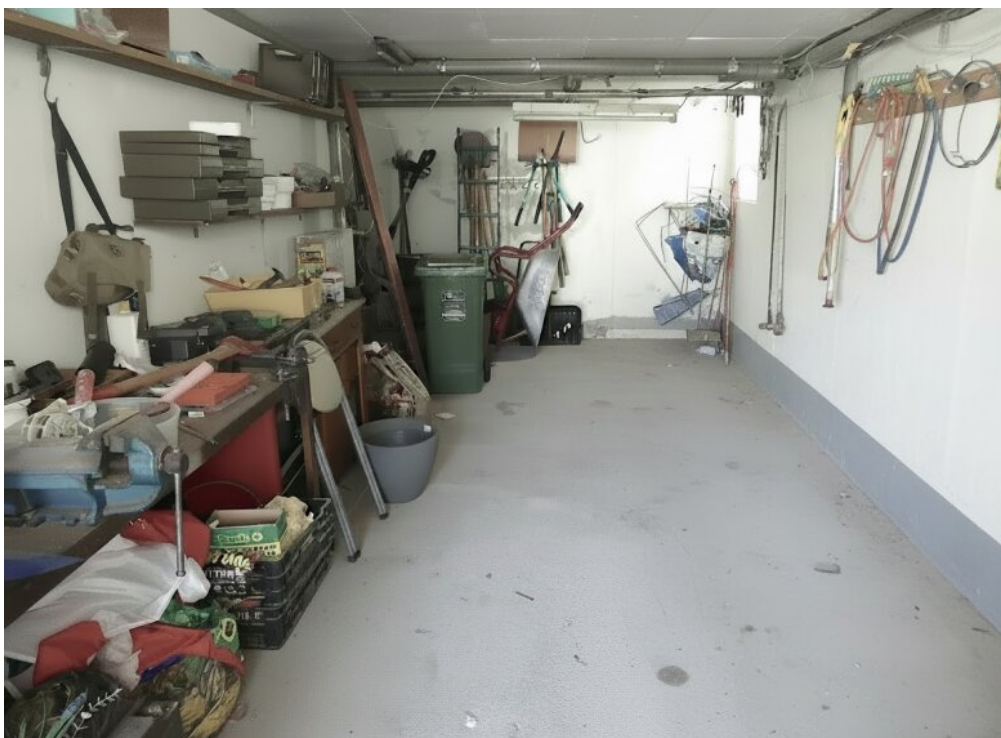
Werkstatt neben der Garage EG