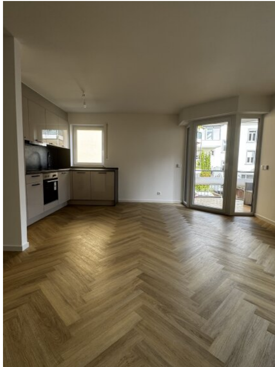
Wohnzimmer-Blick zum Balkon