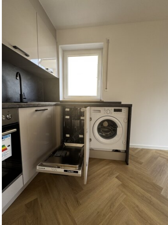
Küche mit Geschirr-Waschm.