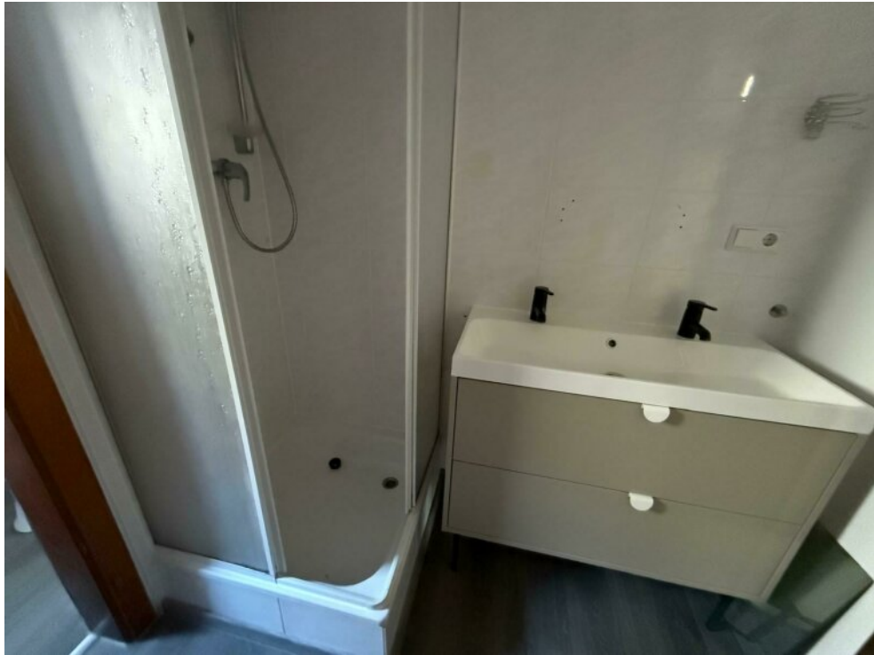
WhatsApp Image 2026-06-10 at 14.50.31x