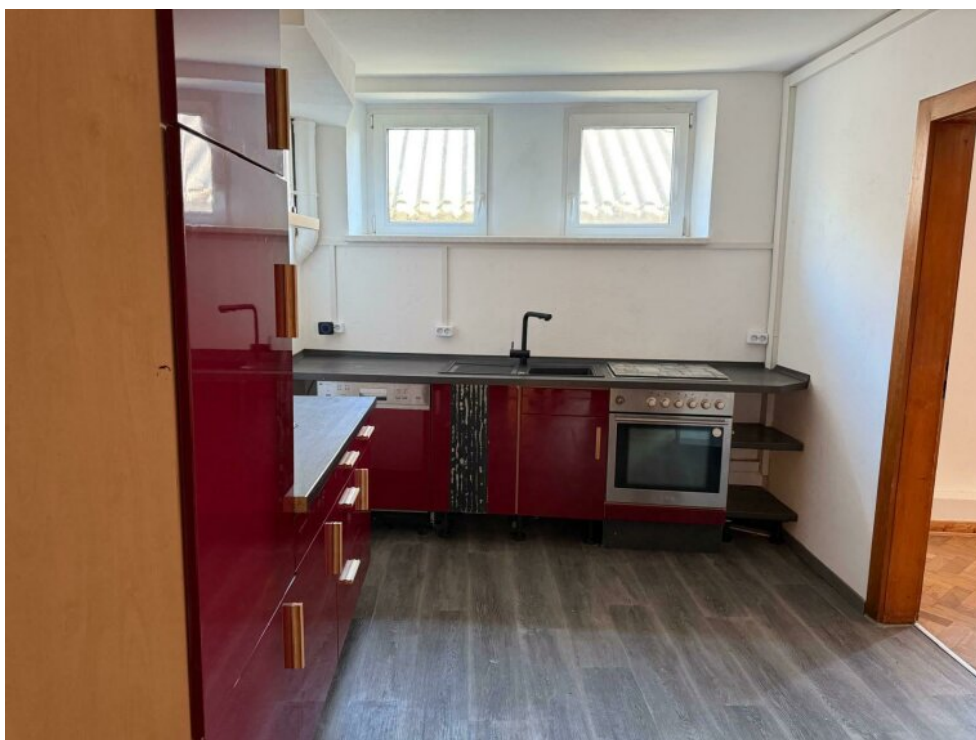
WhatsApp Image 2026-06-10 at 14.50.30