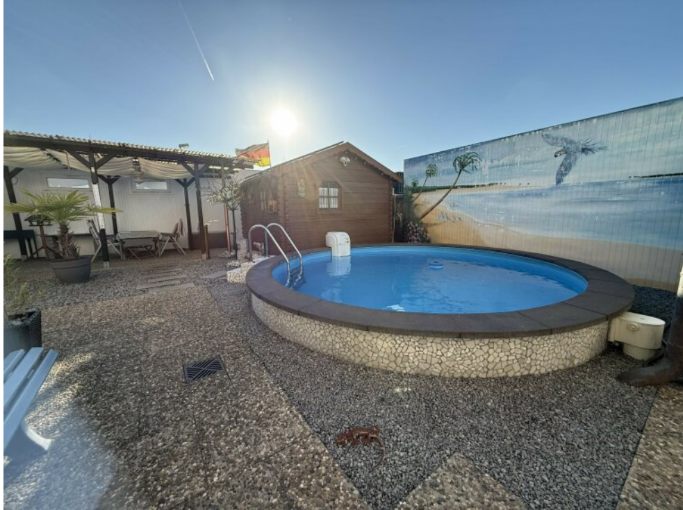
Pool mit Gegenstromanlage