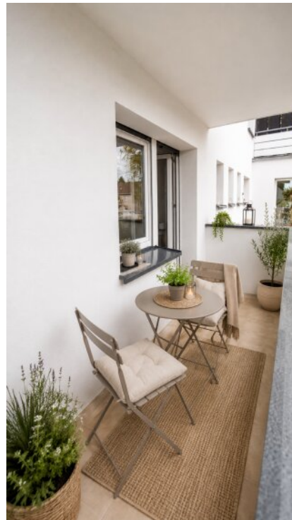
Balkon - virtueller Staging