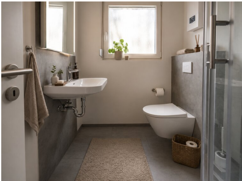
Badezimmer -virtueller Staging