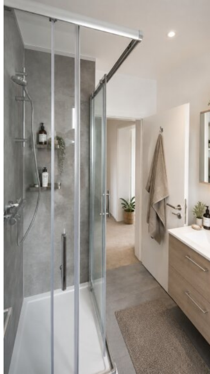
Badezimmer -virtueller Staging