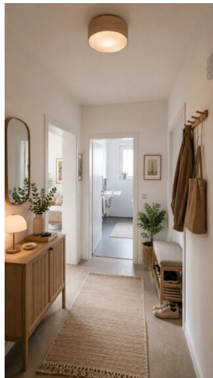
Flur -virtueller Staging