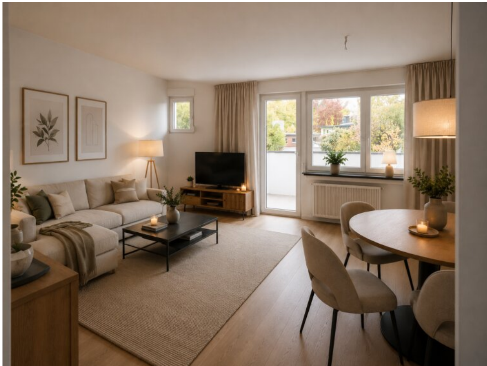
Wohnraum - virtueller Staging