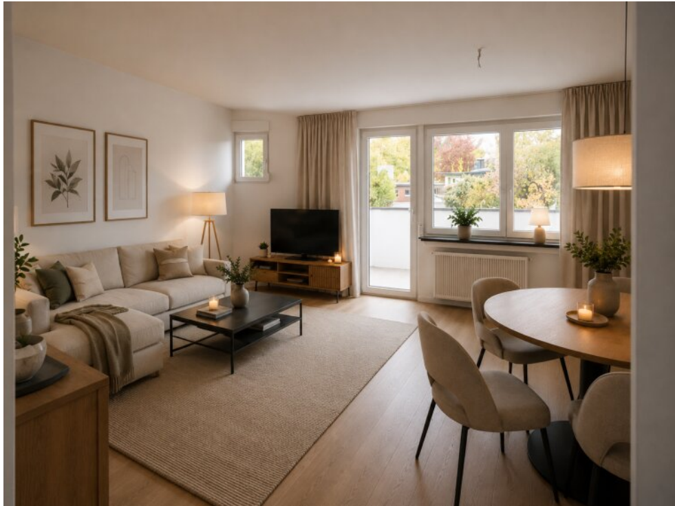
Wohnraum - virtueller Staging