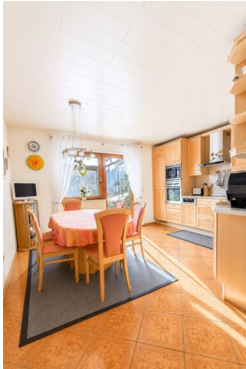
Esszimmer Ausgang Wintergarten