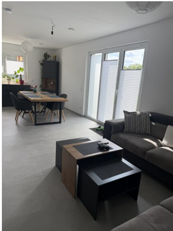
Ess und Wohnzimmerbereich