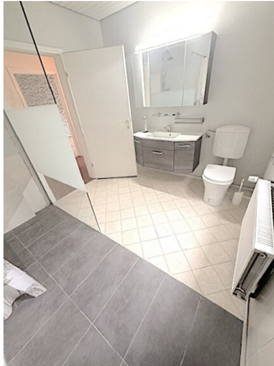
Bad mit begehbare Dusche