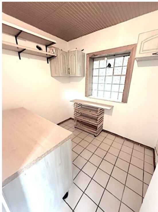
Vorratsraum neben der Küche