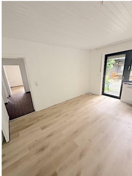
Zimmer mit Ausgang Terrasse