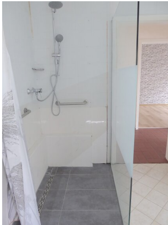
Begehbare Dusche mit Glaswand