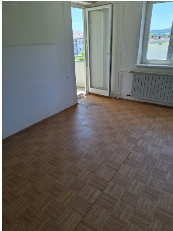
Wohnzimmer mit Ausgang Balkon