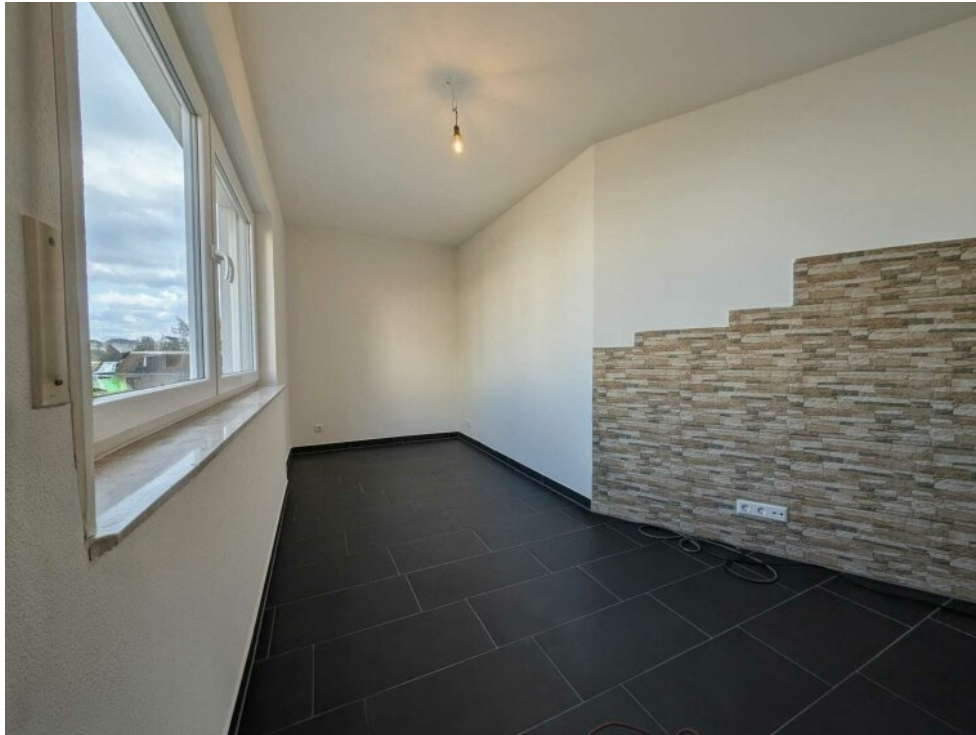
Wellnesraum - Sauna möglich