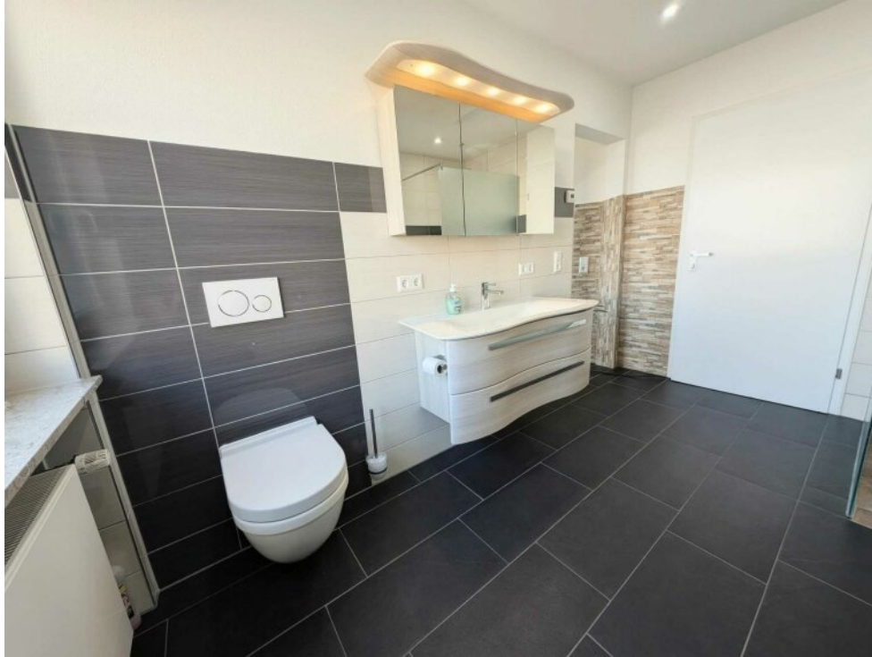
Badezimmer Dusche u. Badewanne