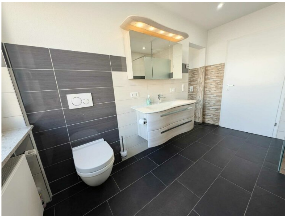
Badezimmer Dusche u. Badewanne