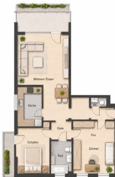
Grundriss nicht maßstabsgetreu